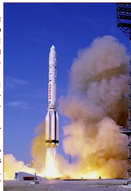
Космодром Байконур. «Протон-К» выводит на орбиту модуль «Звезда» для МКС

За эти годы рядом с космодромом вырос целый город. Он носит такое же название, как и космодром. Много пройдёт времени, много песка перенесут свирепые ветры по степям Казахстана. Но останется Байконур, Королёв, Гагарин как символы, славящие человека, ум и дела его.